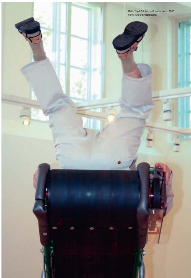
Ride1-3 på Eskilstuna Konstmuseum 2006.