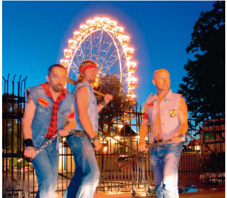
Ride1:1 på Galleri Ping Pong i Malmö 2004